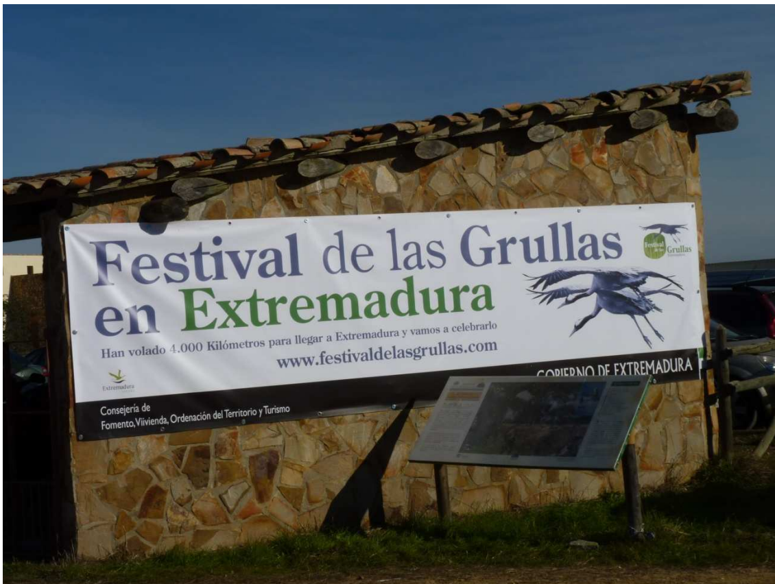
Fête des Grues en Extremadura