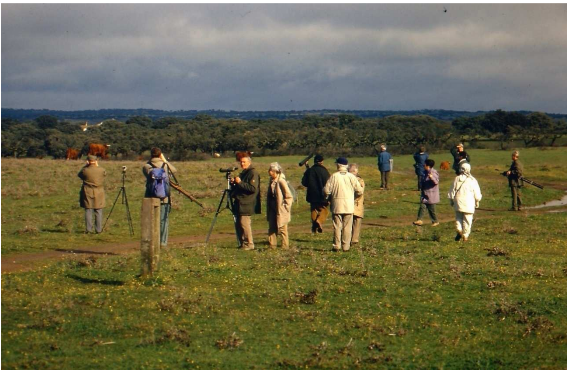
Des Observateurs des Grues

-Cooperer avec d'autres groupes pour l'environnement, CC.AA., et avec d'autres pays qui accueillent des populations de Grues.