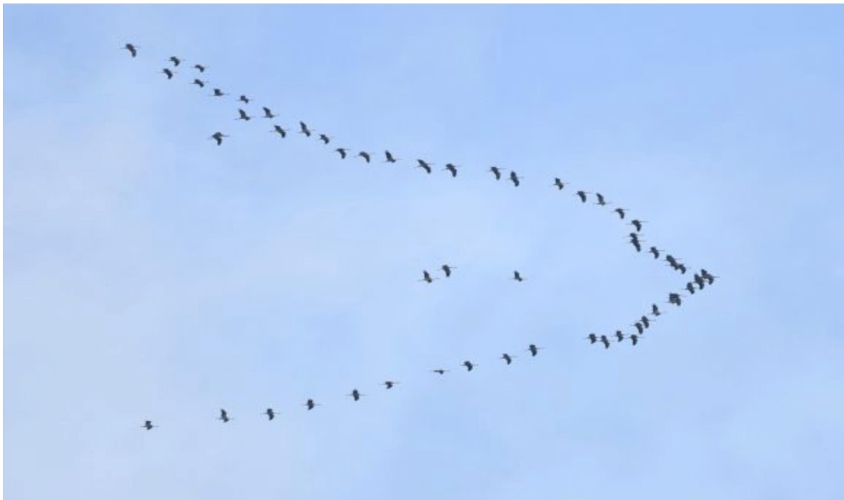
Imagen n°: Grullas sobre Oris (B)