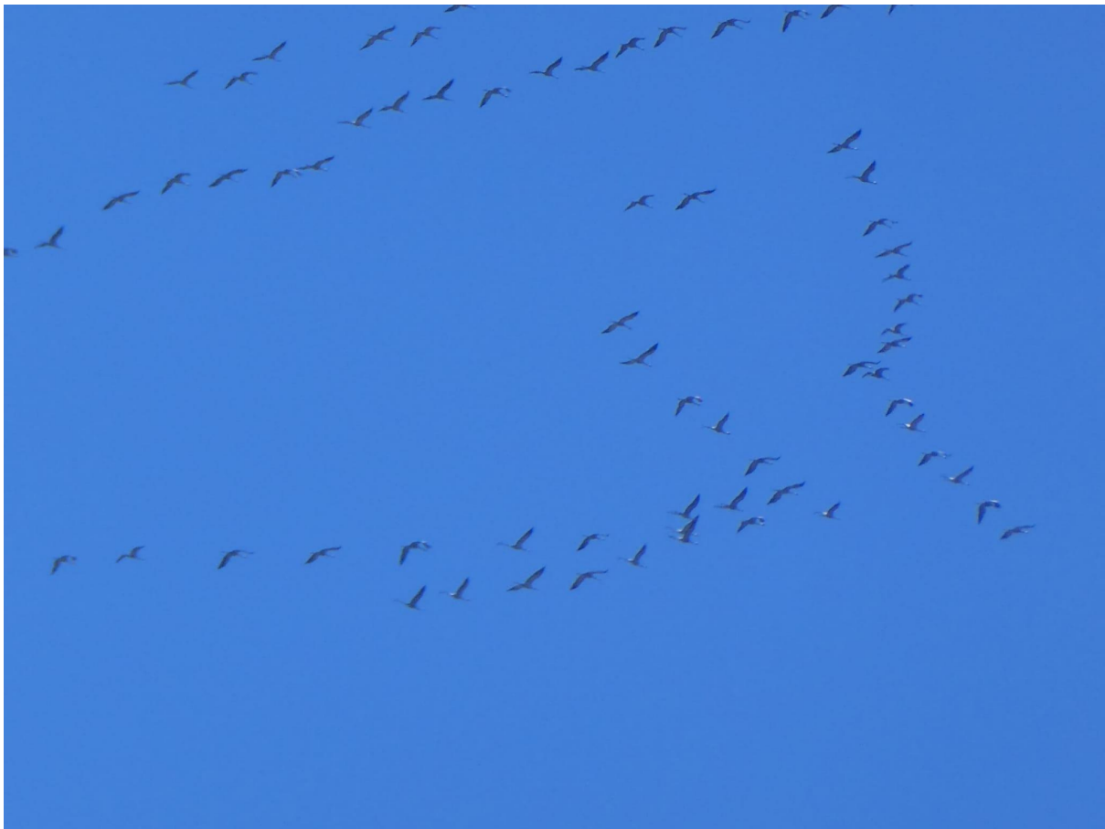
Imagen nº: Grullas migrando por Jaca (HU)